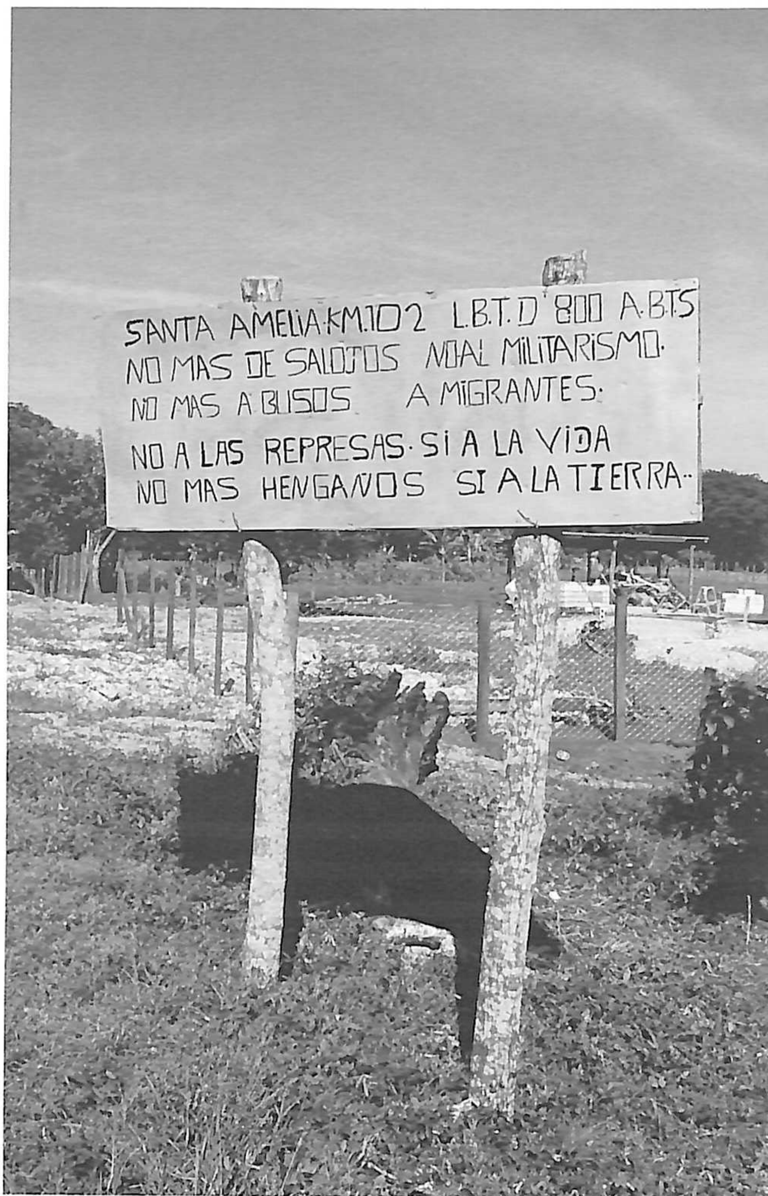
Cartel de respeto a la vida y el territorio en la aldea de Santa Amelia, Petén, Guatemala.