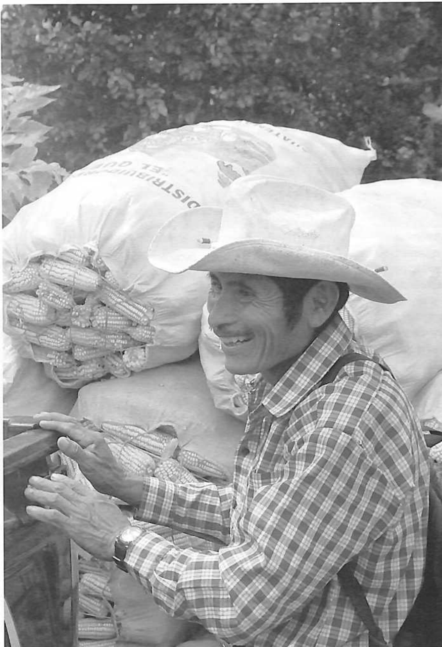
Campeño cargando sacos de maíz seco, Petén.